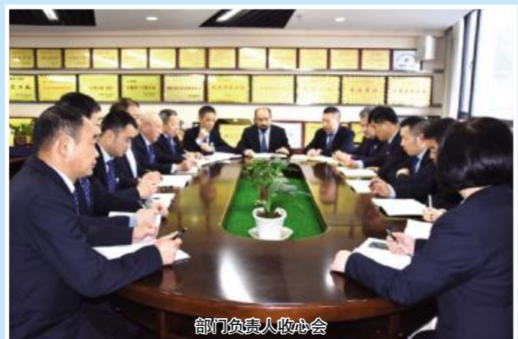
部门负责人收心会