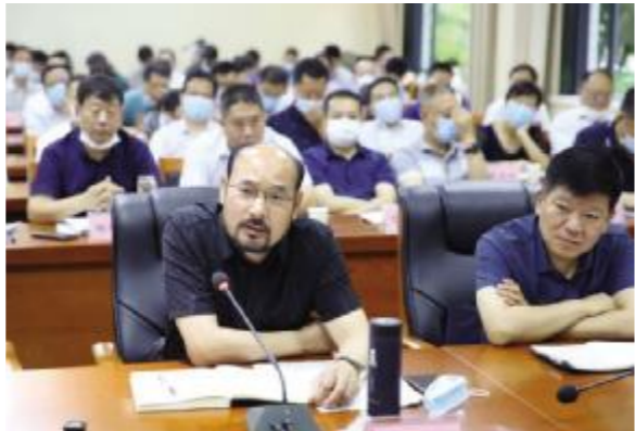
作为民营企业代表在优化营商环境服务保障民营企业发展座谈会上发言

园”。为积极响应号召,支持脱贫攻坚工作,蓝天建筑主动出击,与卡子村结对帮困户各提供2万元支持、出资10万元用于鄂西小河村精准扶贫。近年来,在精准扶贫和慈善公益事业上已累计投入500余万元。